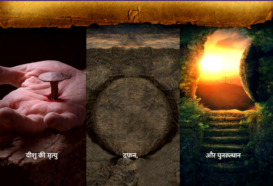
यीशु की मृत्यु

जब मैं बपतिस्मा लेता हूँ, तो मैं यीशु की मृत्यु, दफन और पुनरुत्थान में अपनी विश्वास की पुष्टि करता हूँ।